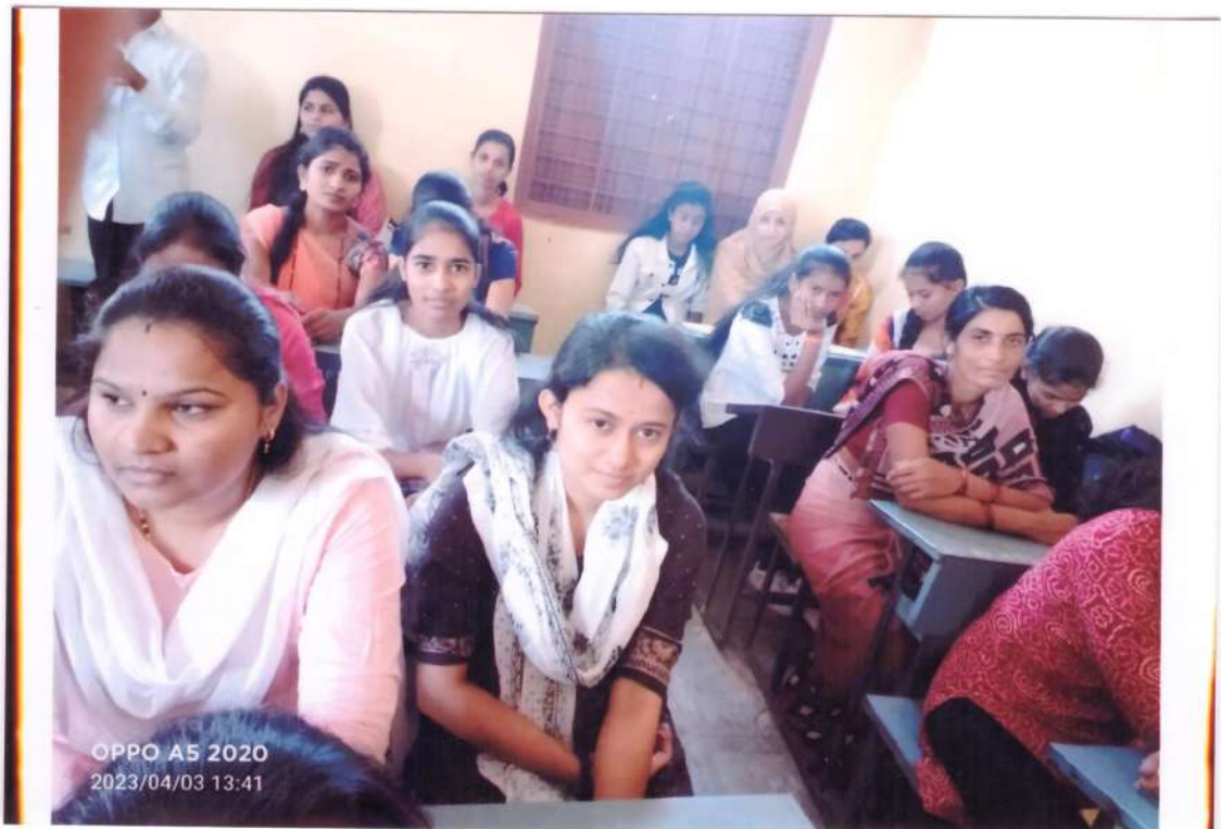
B.Sc. students Present for state level seminar.