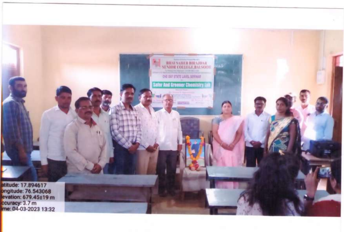
Group photograph on dias on occasion of state level seminar.