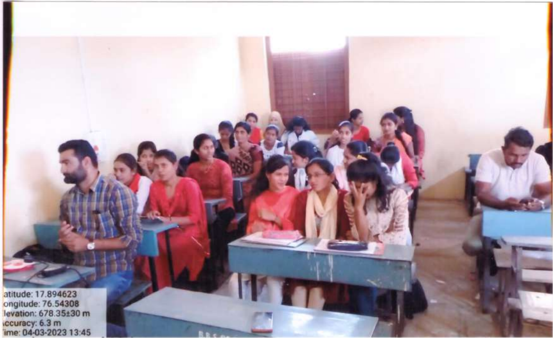
Response of students to state level seminar